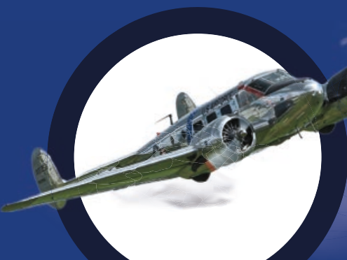
LOCKHEED ELECTRA 10A